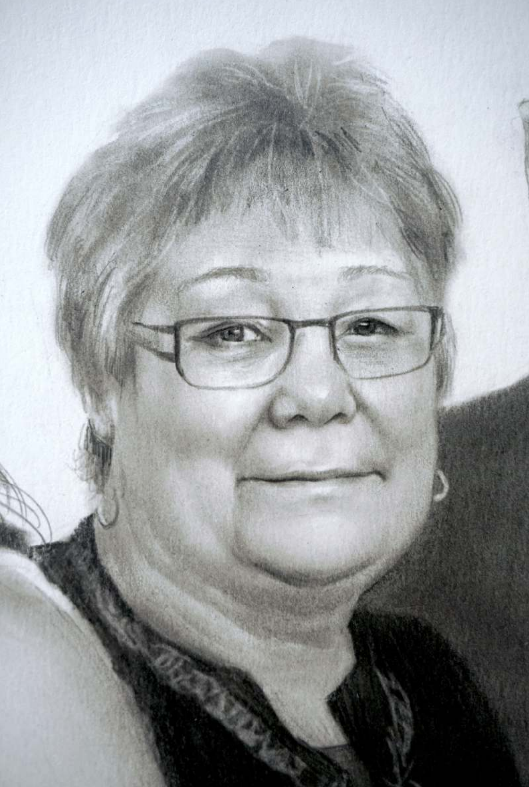
Eine Frau Von Hochzeitsauftrag Bleistift auf Paper 59.4x42cm 07. 2022