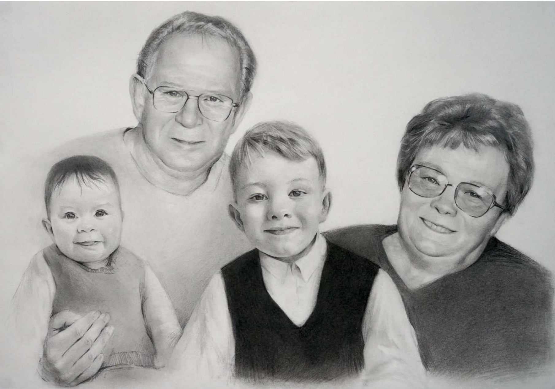
Familienbild für einen Kunden Bleistift auf Paper 59.4x42cm 03. 2021