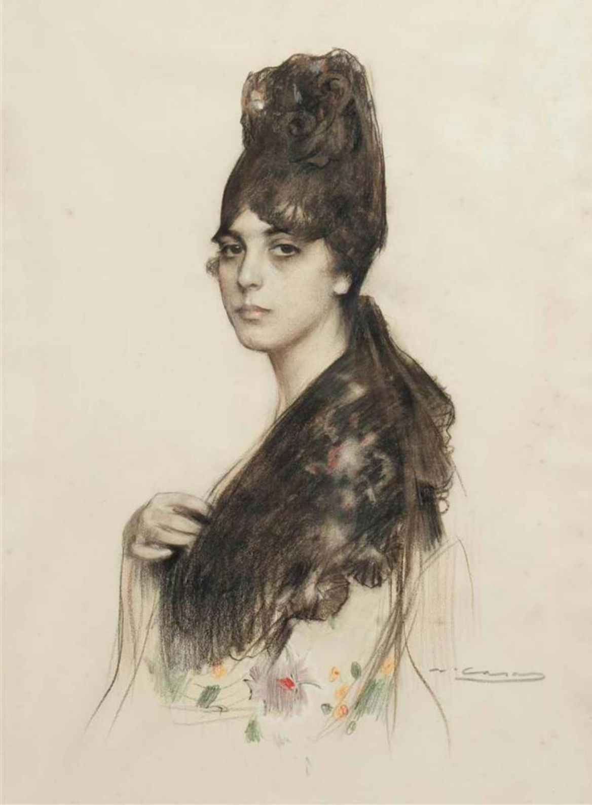
Ramón Casas Girl With A Peineta Comb And A Mantilla Kohle auf Papier, 58x43cm, 1915

Nach jahrelanger Übung, mag ich es eigentlich nicht, Fotografien zu reproduzieren. Zeichnung/Gemälde können eine besondere Ästhetik vermitteln, die Sinn macht. Vor fünf Jahren habe ich Leonardo da Vinci und Michelangelo geliebt, aber jetzt lasse ich mich von Ramón Casas (Picassos Lehrer und Freund) inspirieren und mein Stil ist subtiler und weicher geworden. Ich würde sagen, es eine kleine „Brise“ zu haben.