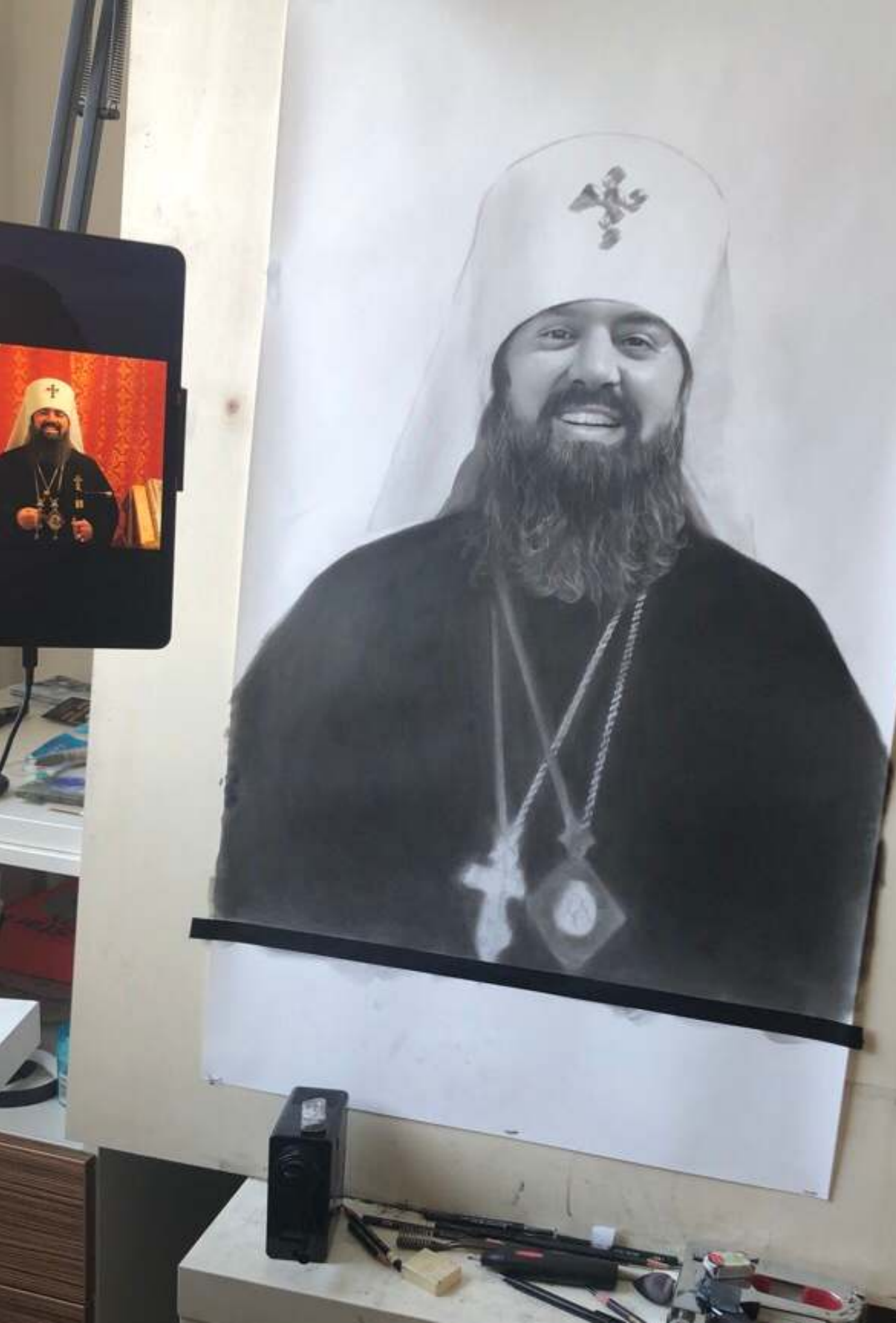
Priester (in Prozess) Bleistift auf Paper 84x59.4cm 06.2022