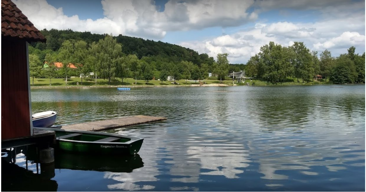
Bootstouren für kleine Abenteuer mit der ganzen Familie