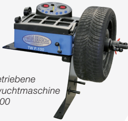
Handbetriebene Reifenwuchtmaschine TW F-100

TW X-610 + TW F-100 Auch im SET erhältlich!